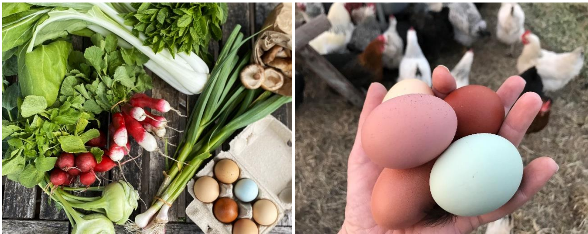
Links een 't Gagel groentepakket uit november (zonder klimaateieren) en rechts onze klimaateieren.

Eén 't Gagel groentepakket is goed voor ongeveer 3 of 4 maaltijden voor twee mensen of een klein gezin. Heb je een groter huishouden of een grotere eetlust, dan kun je twee of meer pakketten bestellen.